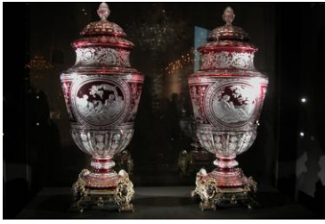
Vases couverts « Simon » 1867

La gravure est une technique de décor consistant à enlever à froid de la matière par bain d'acide ou à l'aide de petites molettes, et par sablage afin de dépolir les zones souhaitées