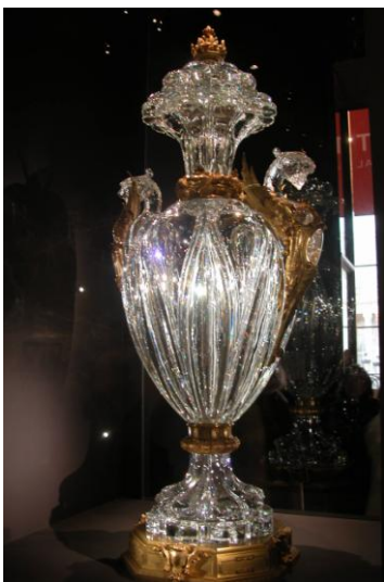
Vase dit du « Négus » 1909

A partir du XIX ème siècle, la palette de Baccarat s'exprime en une multitude de couleurs , obtenues par addition d'oxydes métalliques au cristal clair : le bleu avec de l'oxyde de cobalt, le violet avec de l'oxyde de manganèse, le jaune avec de l'oxyde d'uranium.