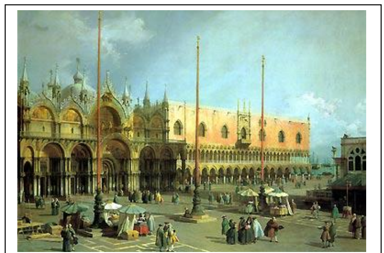
Place Saint Marc