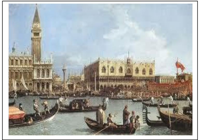
Piazzetta vers le Môle 1740- 1745