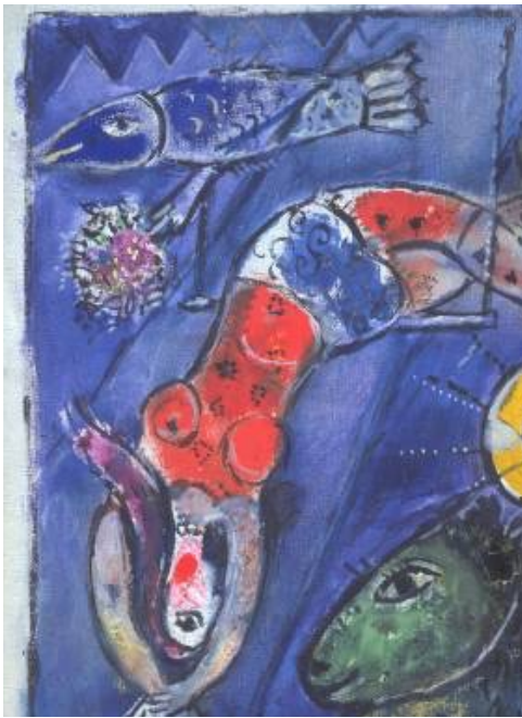
Le Cirque bleu (1950, Théâtre de Francfort)

Le cirque est le thème récurrent de l'illusion du monde avec tous ses symboles, chez Chagall.