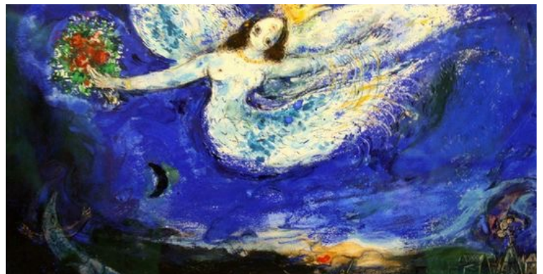
L'Oiseau de Feu (Strawinski 1945)