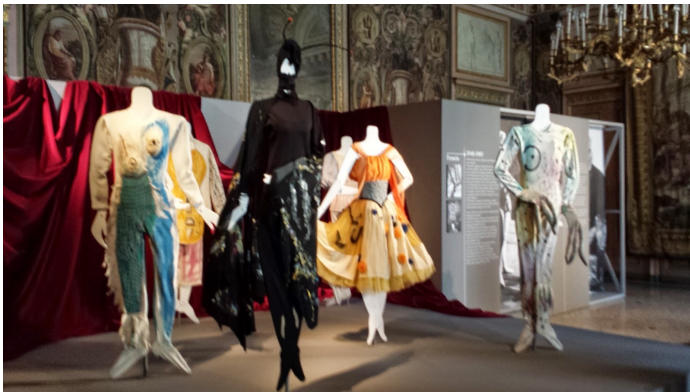
Costumes pour le Ballet Aleko (Pouchkine 1942)

Pendant plusieurs mois Chagall cessera de peindre.