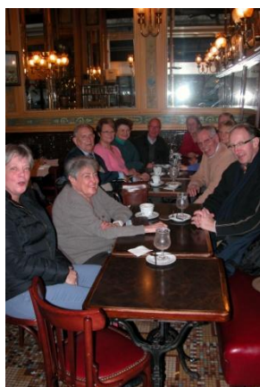
Le groupe des fidèles habitués

Nos sorties du mois de janvier ont semblées plaire à tous : l'exposition sur Saint Louis , les superbes clichés des photographes de l'agence Magnum à l'Hôtel de Ville et le Maroc Contemporain à l'institut du monde arabe.