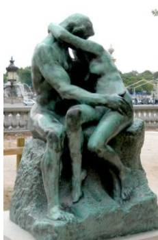
Le Baiser Rodin