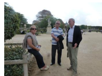
Nos plus belles œuvres modernes !!!!