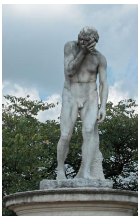
Caïn par H. Vidal

Paris comptait 30 000 ormes, mais depuis 1980, la maladie (graphiose) les a décimés et l'on en compte plus que 1000 dont un devant l'Orangerie.