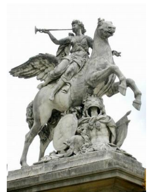
Renommée par Coysevox