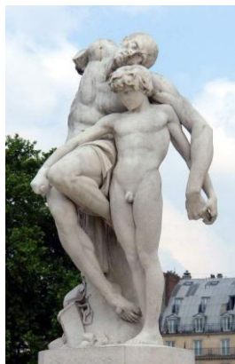
Le serment de Spartacus

En entrant, on découvre un ensemble de statues représentant des personnages de l'Antiquité,