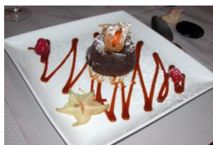
Moelleux au chocolat