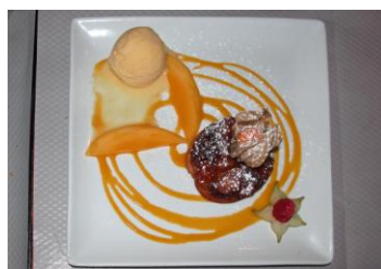
Sorbet à la mangue