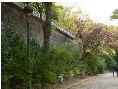
Balustrade de la rue Botzaris

L'origine du nom viendrait du mont Chauve « Calvus Mons ».