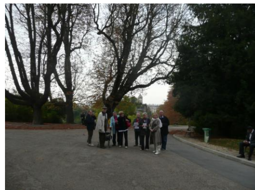
les 3 marronniers au port de chanelie