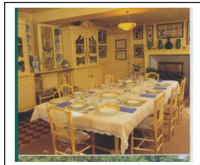
salle à manger